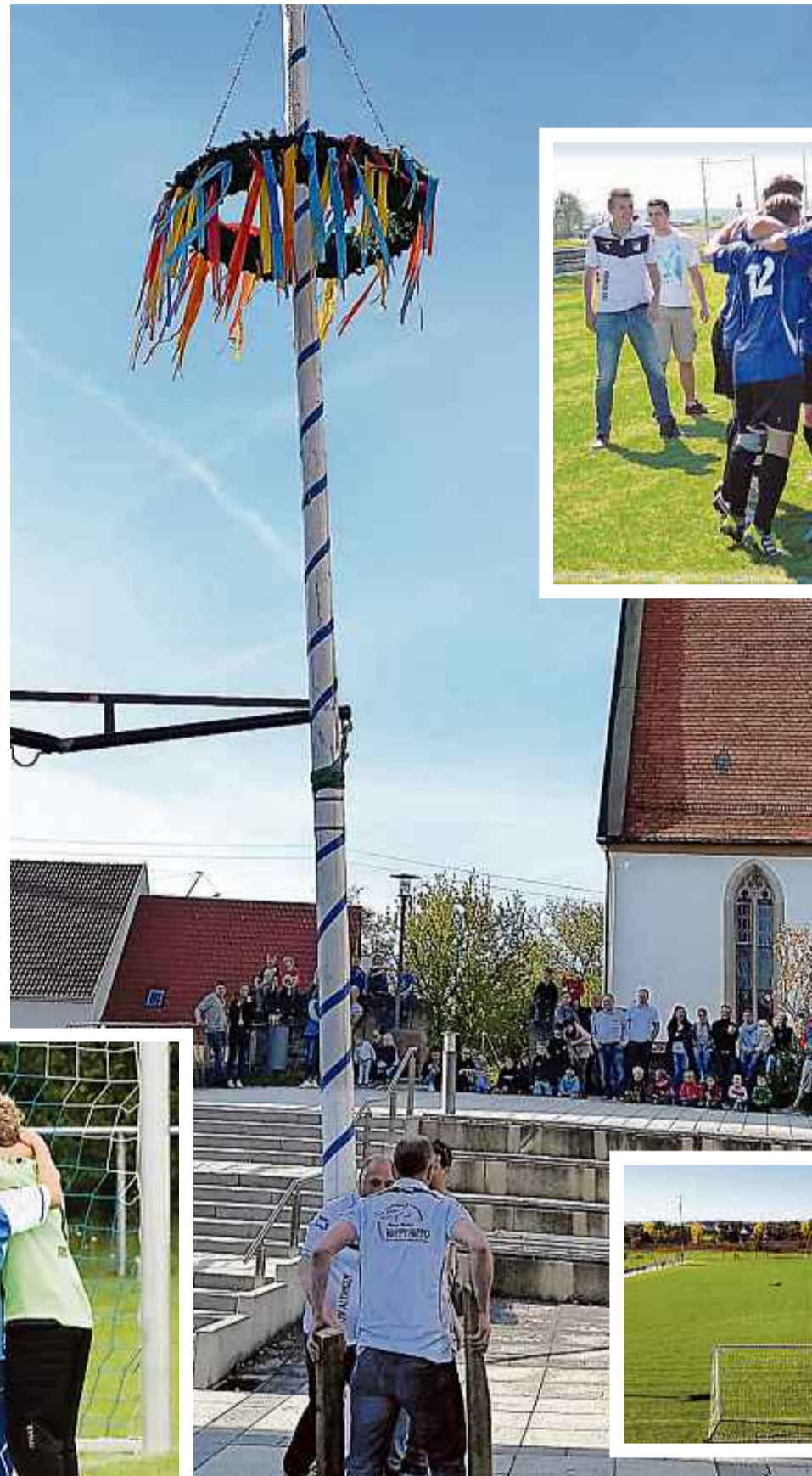
Großer Jubel zum Ende der Saison 2016/2017 (rechts oben): Aufstieg von der Kreisliga A in die Bezirksliga. Der Jugendfußball (links unten) genießt beim TSV Altingen einen hohen Stand – ebenso das Maibaumaufstellen

gangenen Saison, als beide Altinger Fußballmannschaften zeitgleich den Aufstieg in die nächsthöheren Ligen schafften. Während die erste Mannschaft erstmals in der Vereinsgeschichte in der Bezirksliga